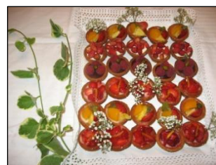
Caprichos de frutas