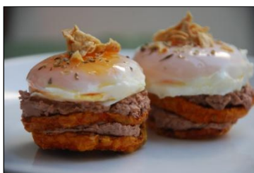
Rascacielos de tomate, bonito y huevo