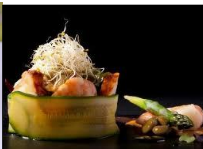
Salteado de gambas y rape