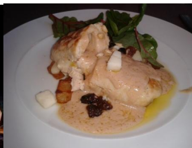
Poularde rellena al foie

El equipo de Karencatering le desea un mejor 2015