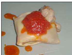
Ravioli de Humus