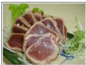
Tatakya de Atún