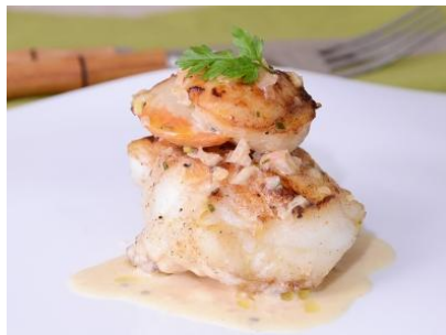
Rape al cava con vieiras