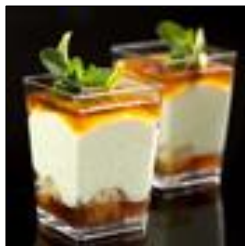
Copitas dulces y saladas