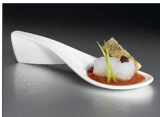
Bacalao confitado con tomate